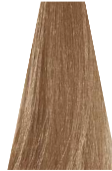
COCOA cacao cacao cacao cacao