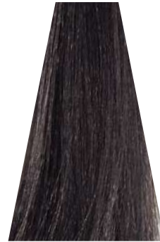
ANTRACITE antracite anthracite antracita antracite