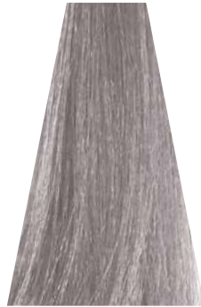
SILVER argento argent plateado prata