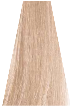
POWDER cipria poudre cipria powder