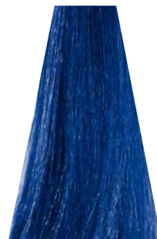
BLUE blu bleu azul azul