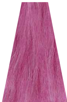
RASPBERRY lampone framboise frambuesa framboesa