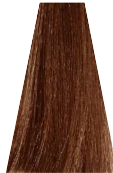
NATURAL EXOTIC LIGHT BLOND biondo chiaro naturale esotico blond clair naturel exotique rubio claro natural exótico loiro claro natural exotico