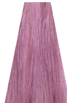
PINK GRAPEFRUIT pompelmo rosa pamplemousse rosé pomelo rosado toranja rosa