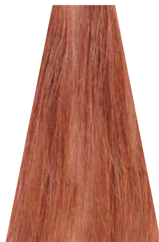
PEACH pesca pêche melocotón pêssego