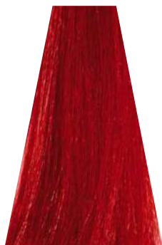
RED rosso rouge rojo vermelho