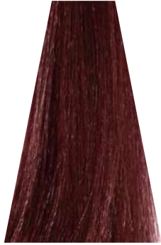
LIGHT RED BROWN castano chiaro rosso châtain clair rouge castaño claro rojizo castanho claro avermelhado