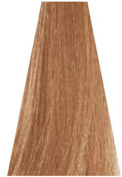
HAZELNUT nocciola noisette avellana avelã