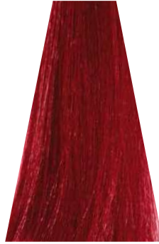
DARK INTENSE RED BLOND biondo scuro rosso intenso blond foncé rouge intense rubio oscuro rojizo intenso loiro escuro avermelhado intenso