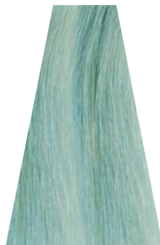
ICY BLUE blu ghiaccio bleu glacé azul hielo azul gelo