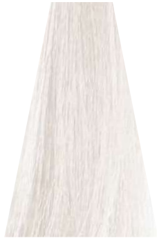
PEARL perla perle perla perola