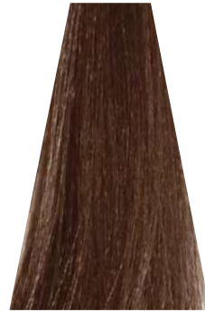
CHILLI CHOCOLATE cioccolato al peperoncino chocolat pimenté chocolate chilli chocolate chili