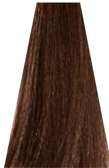
NATURAL EXOTIC MEDIUM BLOND biondo naturale esotico blond moyen naturel exotique rubio medio natural exótico loiro natural exotico