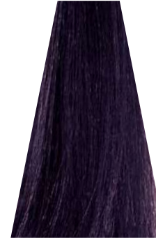
MEDIUM VIOLET BROWN castano viola châtain moyen violet castaño medio violeta castanho violeta