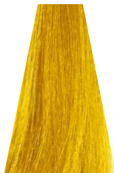
YELLOW giallo jaune amarillo amarelo