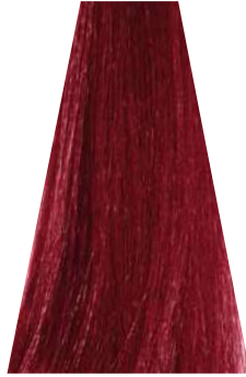
DARK RED BLOND biondo scuro rosso blond foncé rouge rubio oscuro rojizo loiro escuro avermelhado