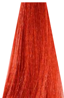
ORANGE arancio orange naranja laranja