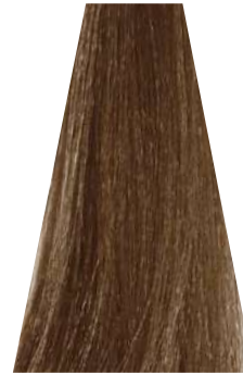
MILK CHOCOLATE cioccolato al latte chocolat au lait chocolate con leche chocolate leite