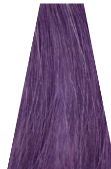
ORCHID orchidea orchidée orquídea orquídea