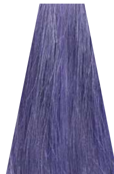
LAVENDER lavanda lavande lavanda lavanda