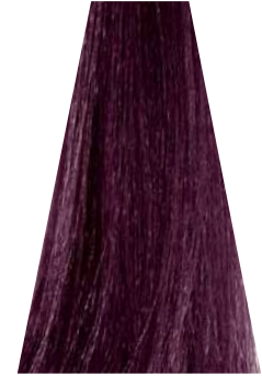
LIGHT INTENSE VIOLET BROWN castano chiaro viola intenso châtain clair violet intense castaño claro violeta intenso castanho violeta intenso