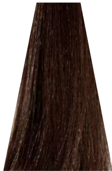
NATURAL EXOTIC LIGHT BROWN castano chiaro naturale esotico châtain clair naturel exotique castaño claro natural exótico castanho claro natural exotico